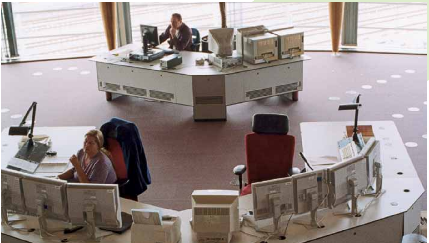
Treinverkeersleiding bij de Nederlandse Spoorwegen.

CIMSOLUTIONS levert hoogwaardige en professionele ICT consultancy diensten en softwareontwikkelingsoplossingen op het gebied van bestuurlijke, administratieve en industriële automatisering. Onze expertise dekt alle fasen af van de software levenscyclus van specificatie en haalbaarheid tot ontwerp, ontwikkeling, test & implementatie, onderhoud, beheer en projectmanagement van zowel maatwerk- als standaardapplicaties, systemen, hardware en netwerken.